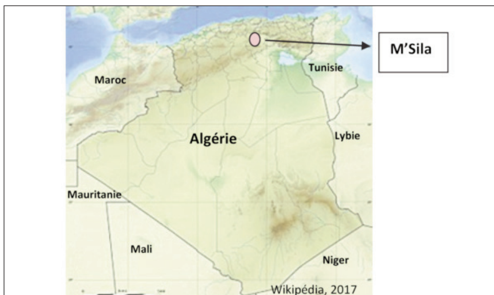
Fig. 1. Localisation géographique de la région de M'Sila.

Dans la région de M'Sila, cette solanacée a été observée dans 5 stations localisées dans des champs de culture du piment (Tableau 1, Fig. 1 et 2).