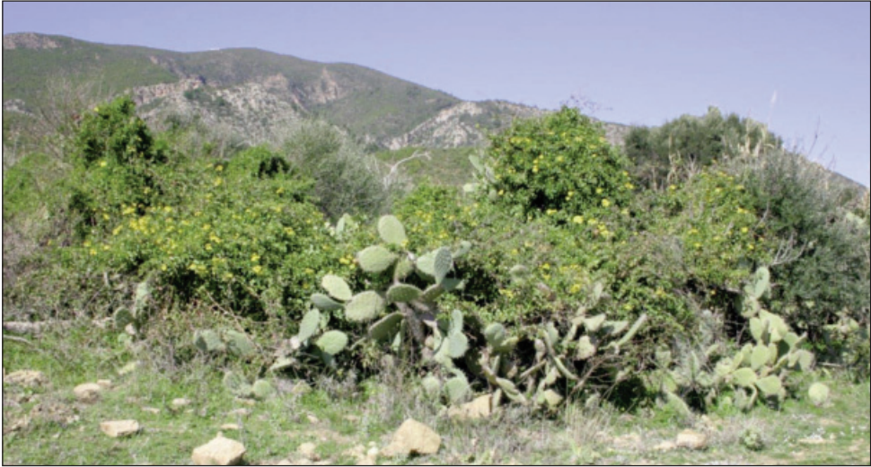
Fig. 3. Biotope de Senecio angulatus (Nador, Tipaza – Algérie).