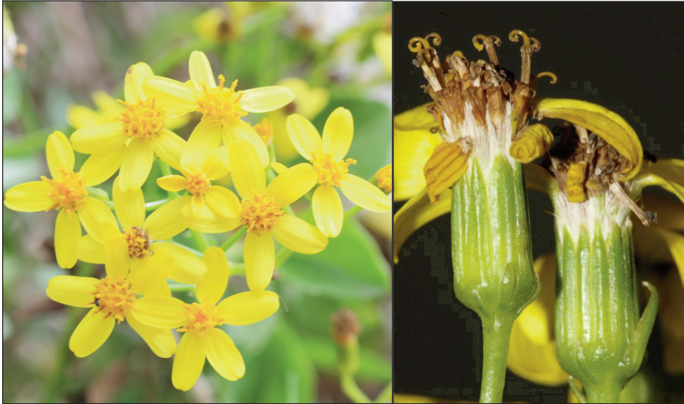
Fig. 2. Capitules de Senecio angulatus (Annaba-Algérie).

Sur le plan économique notamment celui pastoral, cette plante ne présente pas de valeur nutritive ou fourragère pouvant lui attribuer un intérêt agro-pastoral. En effet, les espèces de Senecio sont en général connues pour être toxiques pour le bétail (Burrows & Tyrl 2001; Riet-Correa & al. 2017). Néanmoins, l'étude d'Andreani (2014) montre que cette plante est riche en huiles essentielles et possédant des propriétés antioxydantes ce qui indique un éventuel intérêt économique et médicinal.